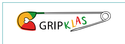
Eva Boon Gripklas