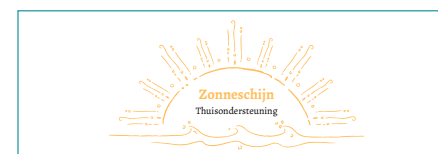
Shusha Kreulen Zonneschijn thuisondersteuning