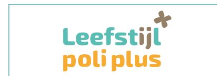
Mia Nijland Leefstijl Poli Plus